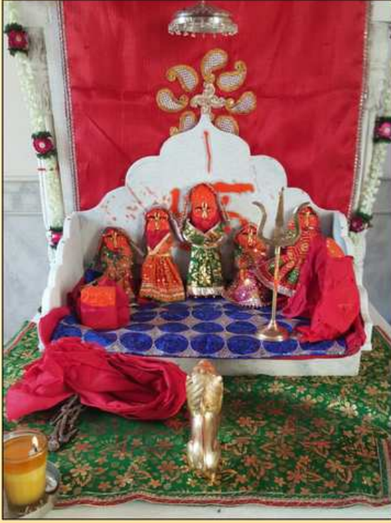
માતાજીનો નવો મઢ