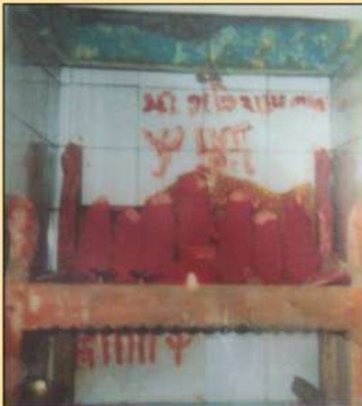
માતાજીનો જૂનો મઢ