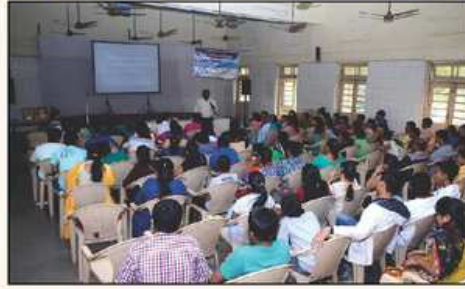
મોટીવેશન કાર્યક્રમ માણતા વિદ્યાર્થી અને વાલીઓ