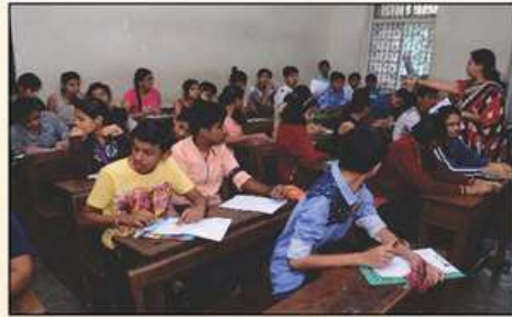
એપ્ટીટ્યુડ ટેસ્ટ આપતા વિદ્યાર્થીઓ